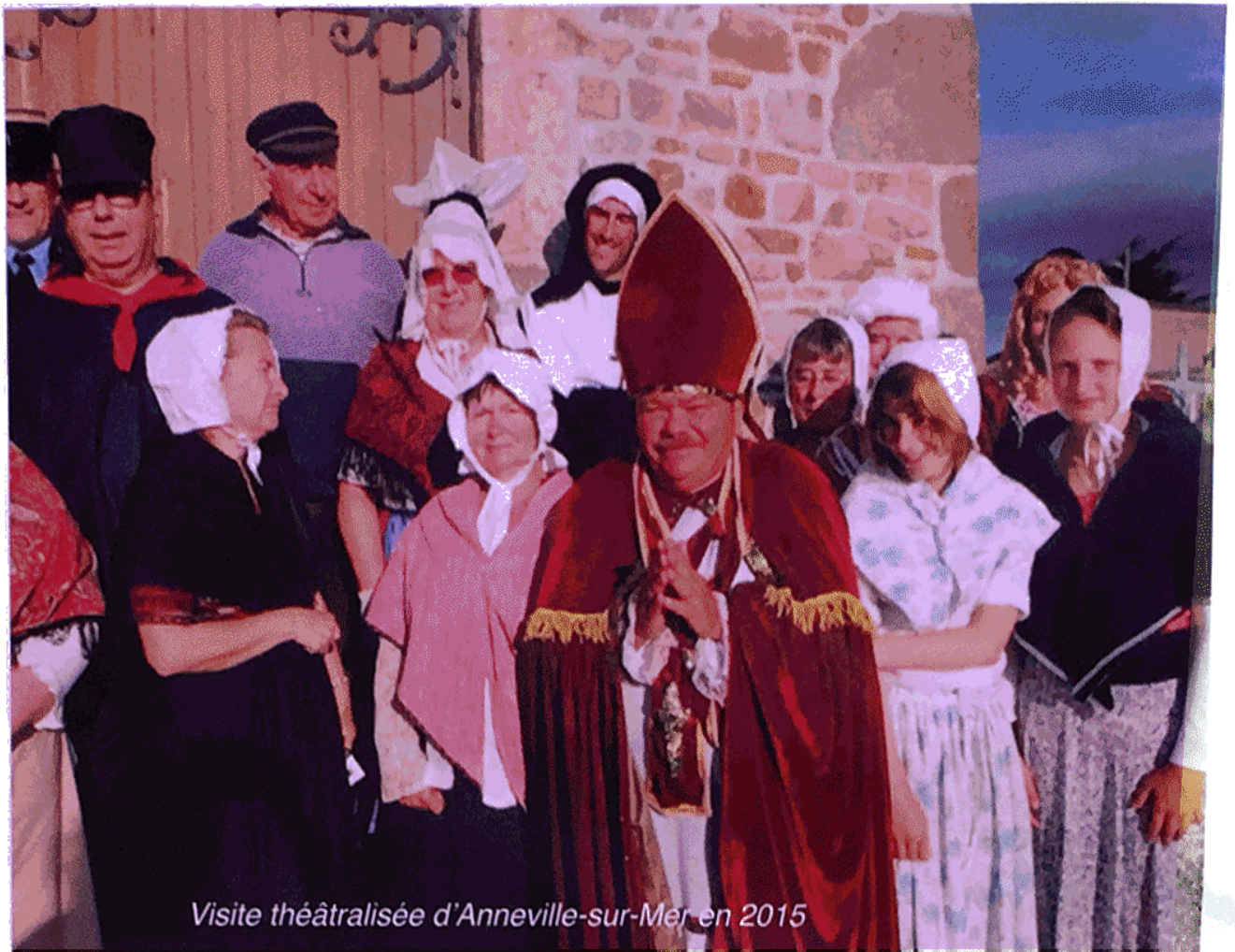
Visite théâtralisée d'Anneville-sur-Mer en 2015

landes « ensorcelées » de Jules Barbey d'Aurevilly, de la Dame Blanche et de bien d'autres histoires rebondissantes. L'Office de Tourisme vous donne rendez-vous le jeudi 21 juillet 2016 à 20h30 à l'église Sainte-Geneviève du Buisson. Un verre de l'amitié clôturera cette soirée. Venez nombreux !