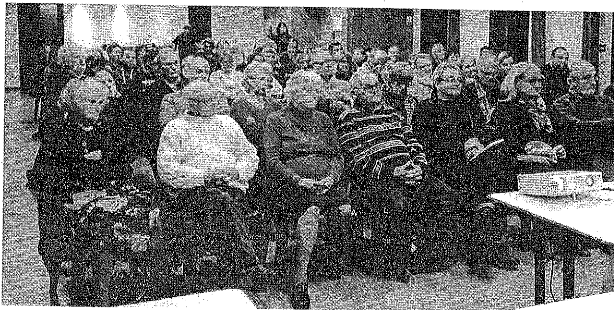
Une centaine de personnes étaient présentes à la réunion d'information sur l'assainissement collectif.

Cent vingt-deux branchements sont prévus pour le centre-bourg et les villages attenants. Une extension portera ces branchements à 150.